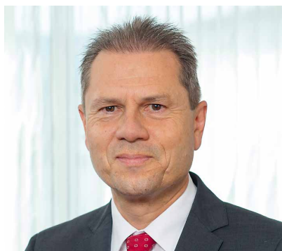
Verwaltungsratspräsident, Ruag Holding

Ihr Motto für gutes Leadership? Inspirierende Ziele setzen, Partizipation und Empowerment der Teams ermöglichen, effektive Zusammenarbeit sicherstellen.