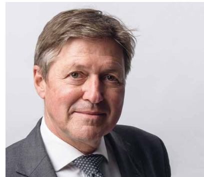
Partner/Co-Owner, Implement Consulting Group

Wie halten Sie sich fit für künftige Herausforderungen? Best Practice und Erfolgsgeschichten, „learn from the best“, studieren und sich laufend um eine plausible Vorstellung der Zukunft bemühen, „learn from the future“.