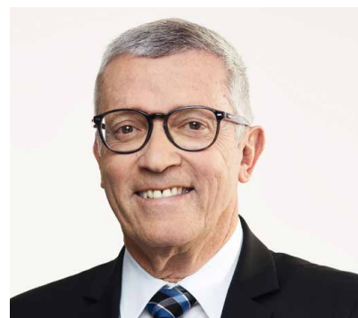
Mitglied des Verwaltungsrats, Bank Julius Bär und Helvetia Versicherungen

Grösste Leadership-Herausforderungen? Die permanente Balance finden zwischen Bewährtem und Neuem – dabei mutig sein und auch unternehmerisch Risiken in Kauf nehmen. Agilität und Geschwindigkeit in der Entwicklung und Umsetzung sind die Schlüsselworte.