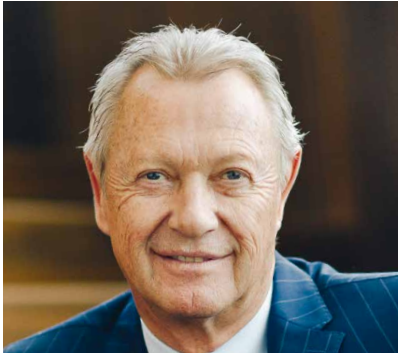
Mitgründer & Stiftungsratspräsident, Bullens Heimann & Friends Foundation

Ihr Motto für gutes Leadership? Den Mut zu haben, sich selbst zu sein, offen und authentisch zu kommunizieren und mit der eigenen Entscheidungskraft eine Vision in die Realität umzusetzen.